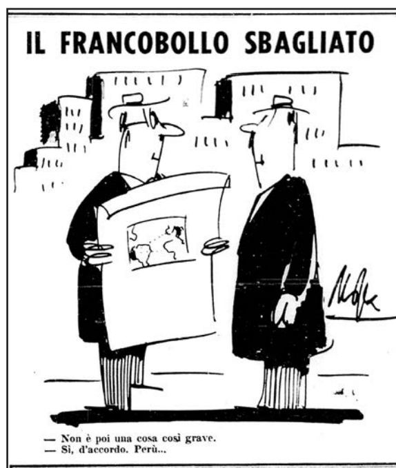
Fig.10 - Tra le numerose vignette, questa pubblicata dal “Corriere d'informazione” del 7-8 aprile.

Intanto, c'è anche chi cerca di scucire un sorriso. È il “Corriere d'informazione” del 7-8 aprile (Fig.10). Una vignetta umoristica su tre colonne titola “Il francobollo sbagliato” e vede il confronto tra due distinti signori.