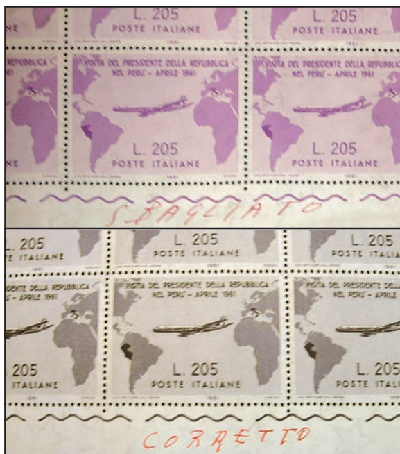
Figg.1 e 2 - Conservati nell'edificio dell'Ipsz -nel 2006, all'epoca delle foto, in piazza Verdi a Roma- i fogli con il “Gronchi rosa” e il “Gronchi grigio”. Interessanti le indicazioni manoscritte presenti sulle cimose.

Fin qui, il programma. Le cose, però, vanno diversamente, almeno per il taglio più alto, e persino i manuali rivolti ai principianti non mancano di raccontarle. “Tutti sanno -scrive ad esempio Fernando Amedeo Rubini nel 1969 in «I francobolli»-