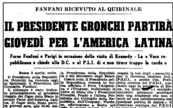
Fig.13 - Uno degli articoli dedicati alla visita del presidente in America Latina, nel caso specifico pubblicato il 4 aprile dal "Corriere della sera".

Di tutto questo, mezzo secolo dopo, resta ben poco. Tranne, appunto, la serie di francobolli e in particolare il 205 lire... sbagliato!