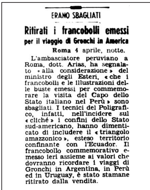
Fig.7 - Appena un "box", invece, per il "Corriere della sera" dello stesso giorno.