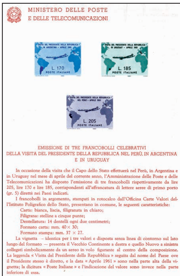
Fig. 3 - Il bollettino illustrativo con le immagini dei valori definitivi.