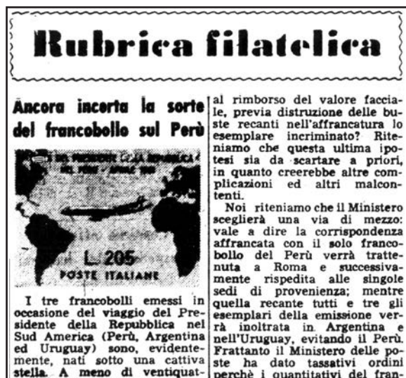
Fig.9 - Il 6 si accavallano le ipotesi; qui il “Giornale di Brescia”.

Ancora generoso lo spazio riservatogli dal “Giornale di Brescia” (Fig.9). L'immagine del 205 lire, ormai conosciutissima, il riassunto di quanto accaduto e il punto su quei filatelisti che “avevano provveduto, sin dalle prime ore della emissione, a far inoltrare all'ufficio Ferrovia di Roma numerose buste affrancate con i tre francobolli per la successiva spedizione aerea”. Filatelisti che ora “si chiedono quale sarà la sorte riservata alla loro corrispondenza: compirà regolarmente il viaggio con l'apparecchio presidenziale o verrà restituita alle singole amministrazioni postali e da queste riconsegnata ai mittenti? O si provvederà al rimborso del valore facciale, previa distruzione delle buste recanti nell'affrancatura lo esemplare incriminato? Riteniamo che questa ultima ipotesi sia da scartare a priori, in quanto creerebbe altre complicazioni ed altri malcontenti. Noi riteniamo che il ministero sceglierà una via di mezzo; vale a dire la corrispondenza affrancata con il solo francobollo del Perù verrà trattenuta a Roma e successivamente rispedita alle singole sedi di provenienza; mentre quella