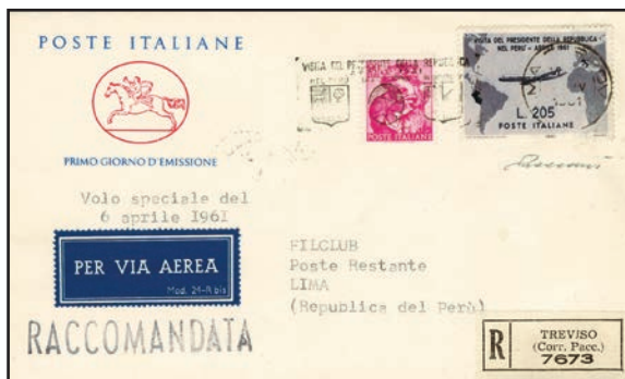
Fig. 4 - L'esemplare grigio, applicato d'ufficio, in realtà nasconde quello rosa.

già inoltrate da un nuovo tipo in grigio". Concetti ribaditi dallo stesso autore nel 2005 in "Storia postale o storia postale?", dove lo definisce "un caso postale unico al mondo: ritirato il mattino seguente l'emissione a causa di un errore nel disegno, fu ricoperto dalle Poste a proprie spese con un nuovo tipo corretto, e stampato in grigio, sulle corrispondenze fatte affluire a Roma per l'inoltro con l'aereo presidenziale" (Figg. 4 e 5).