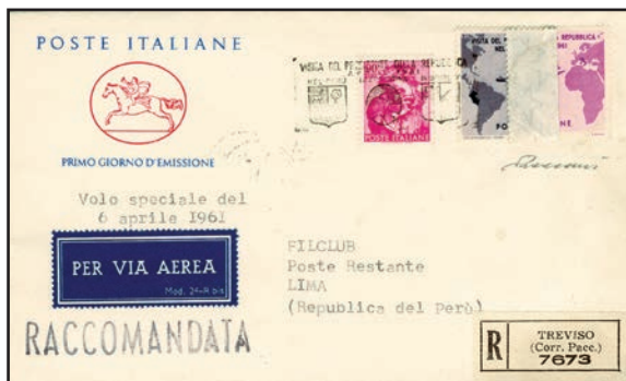
Fig. 5 - L'esemplare rosa nascosto.