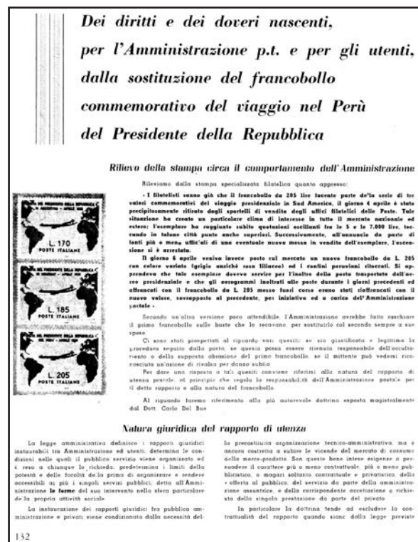
Fig.12 - Il problema è stato analizzato anche dal punto di vista giuridico, con un lungo intervento ospitato da “Rassegna postelegrafica” nel numero di maggio 1961.