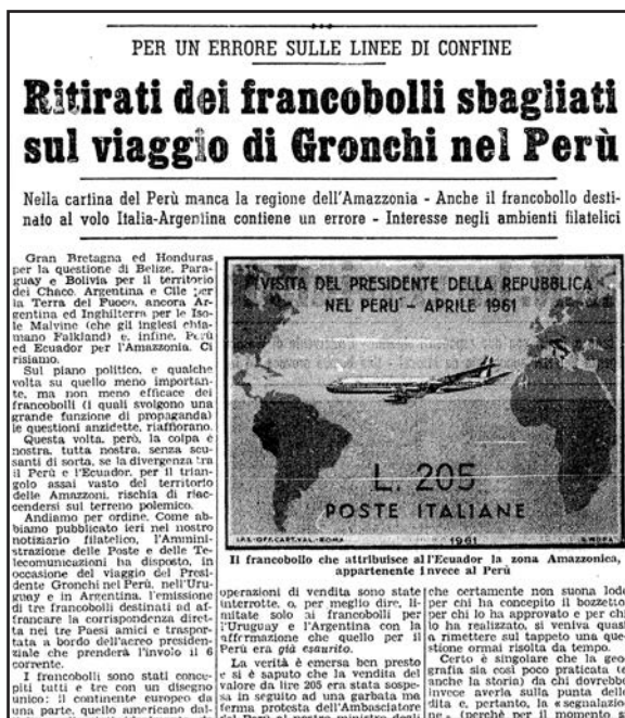
Fig. 8 - Anche "Il messaggero", sempre il 5, concede una larga attenzione, e compare il francobollo incriminato.